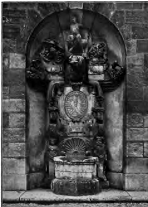
Le Puits d'Amour.

Il est à remarquer que les architectes dijonnais de ce temps ont été avant tout préoccupés d'amortir les angles, de décorer les toitures,